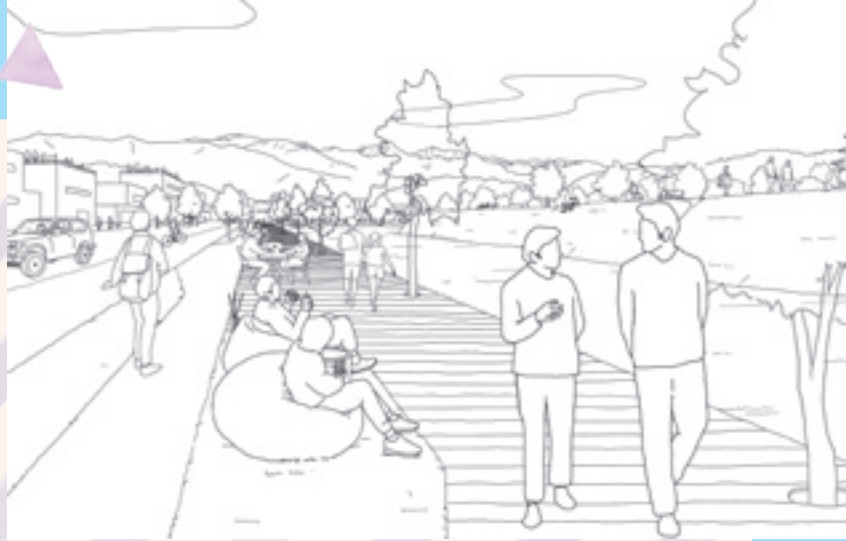
歩道の活用イメージ（三の丸エリアビジョンから）