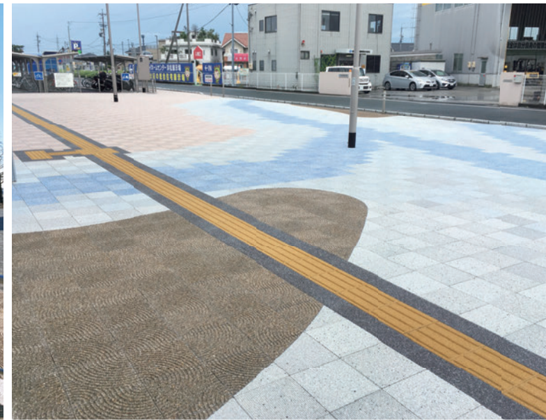
天竜川駅南口駅前広場 (静岡県浜松市)