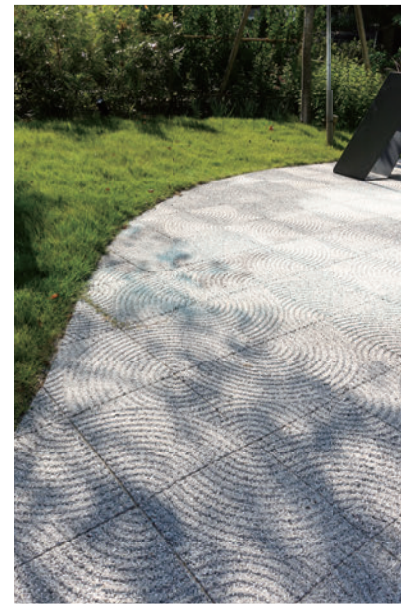
オフィスタワー (神奈川県横浜市)