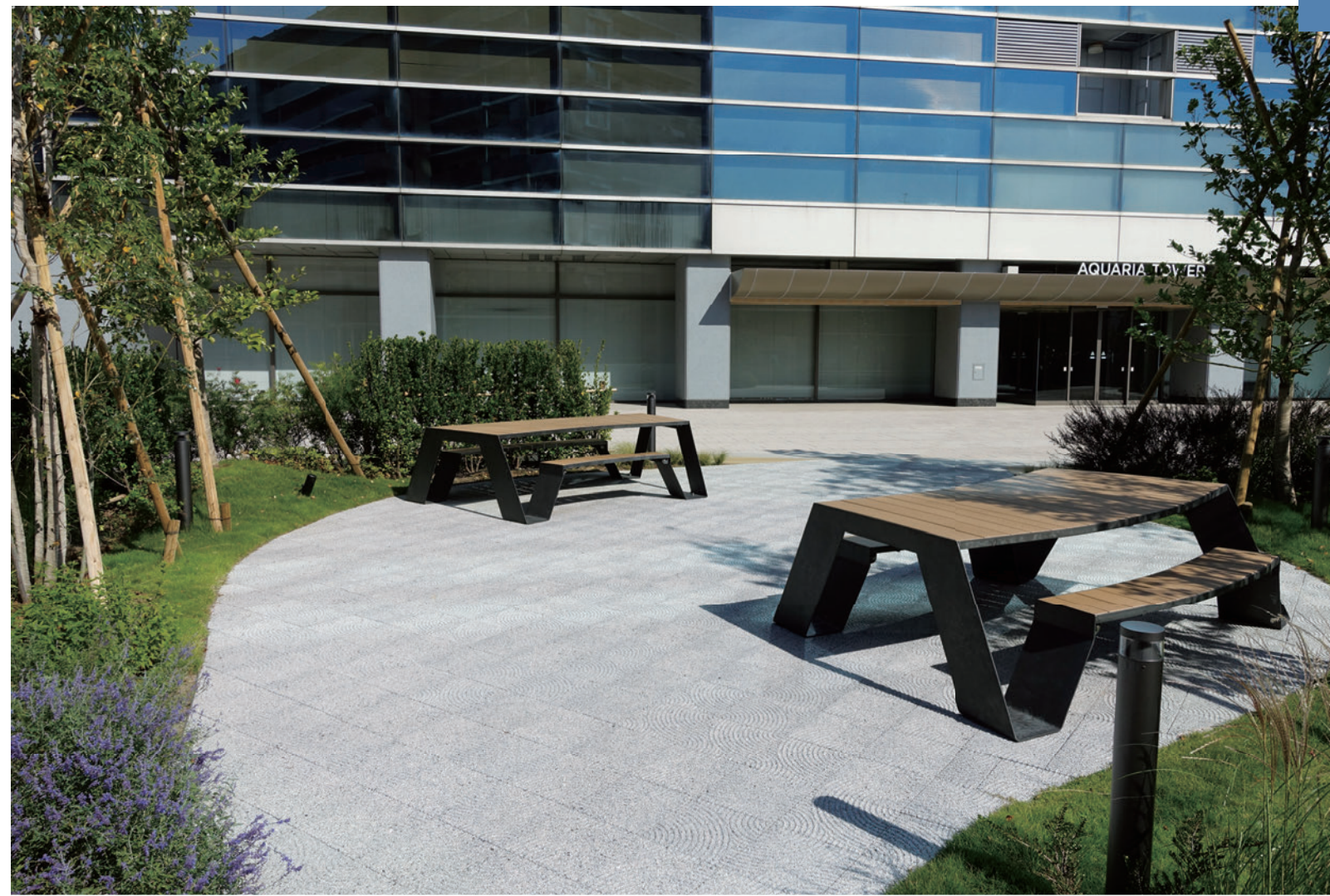
オフィスタワー (神奈川県横浜市)