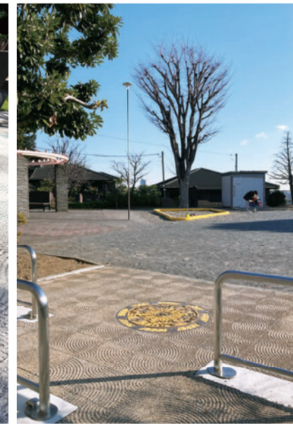
東寺尾四丁目公園 (神奈川県横浜市)