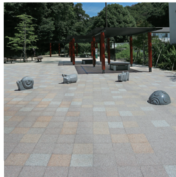
県立東高根森林公園 (神奈川県川崎市)