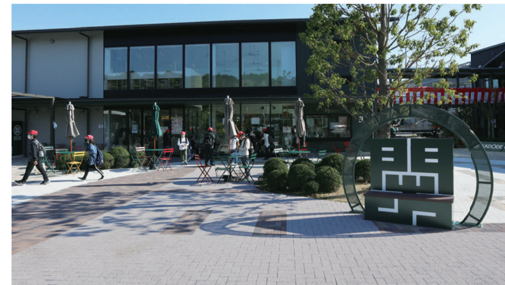
KADODE OOIGAWA (静岡県島田市)