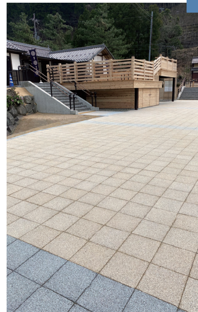
道の駅 若狹熊川宿 (福井県三方上中郡若狹町)