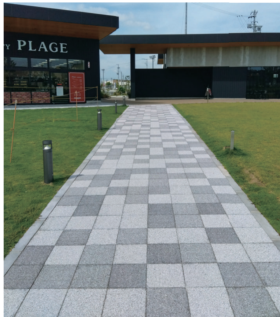
袋井市商業施設 (静岡県袋井市)