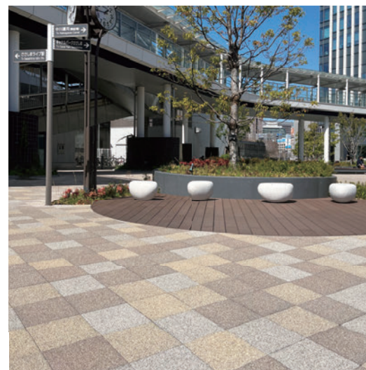
ささしまライブ駅前広場 (愛知県名古屋)