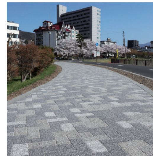
諏訪湖サイクリングロード (長野県諏訪市)