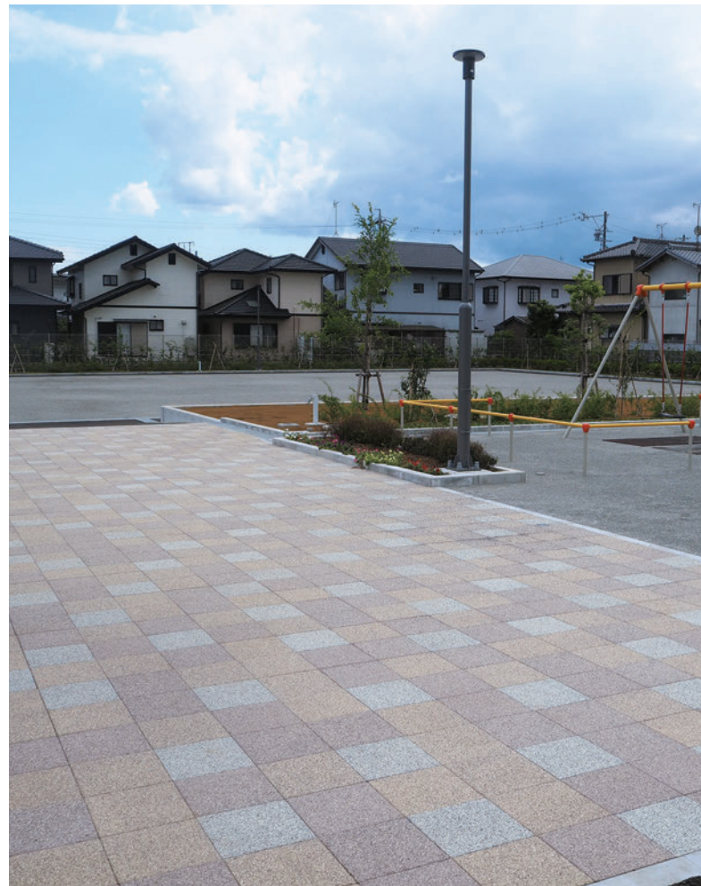
高柳公園(静岡県藤枝市)