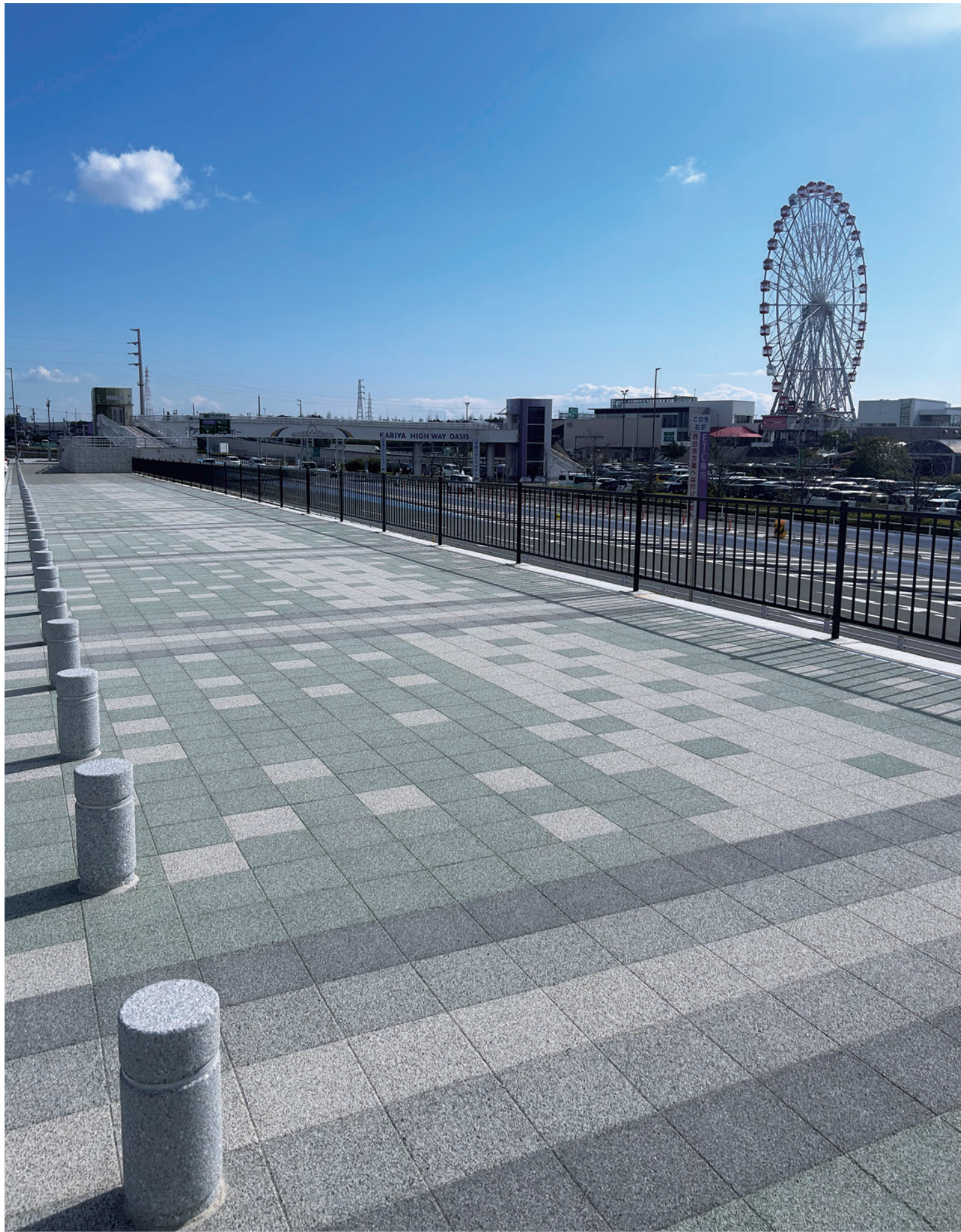
岩ヶ池公園(愛知県刈谷市)