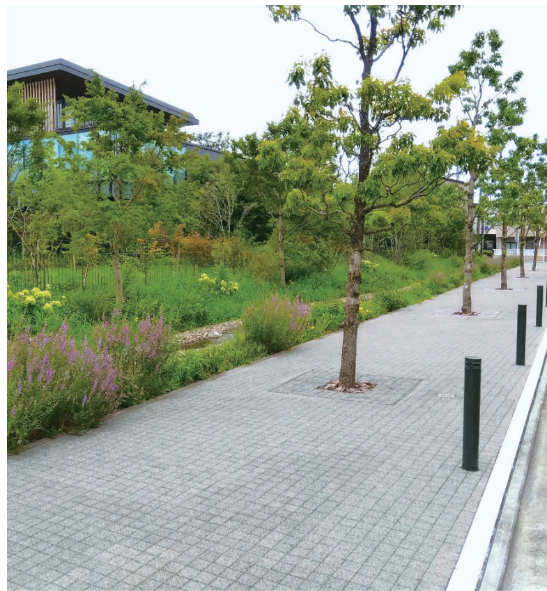
静岡第一テレビ(静岡県静岡市)