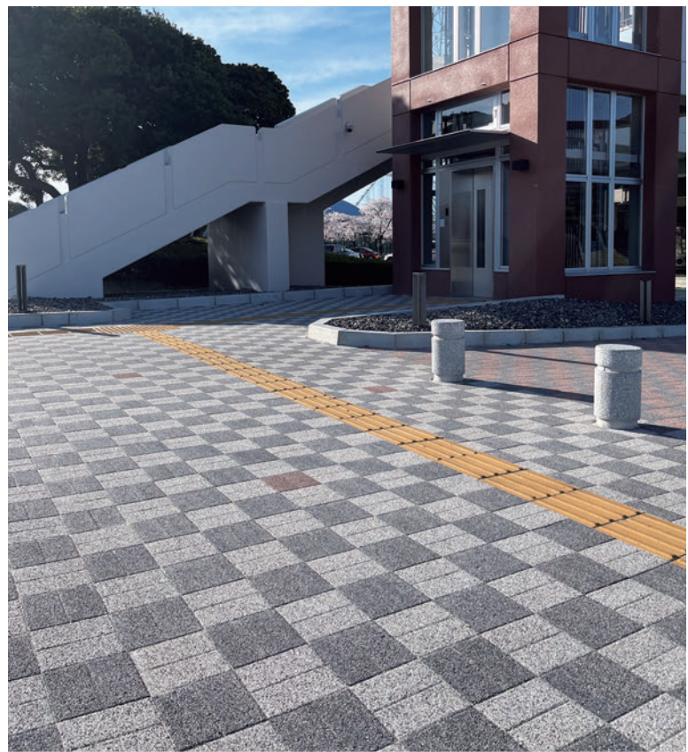
グリーンベース春日井(愛知県春日井市)