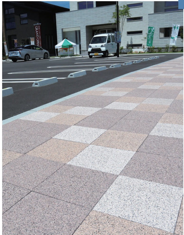
諏訪住宅公園(長野県諏訪市)