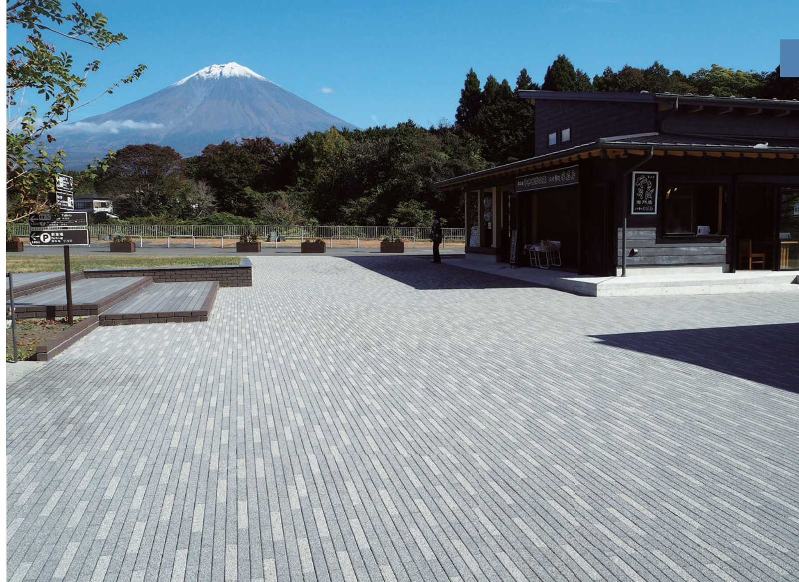
富士山・白糸ノ滝テラス (静岡県富士宮市)